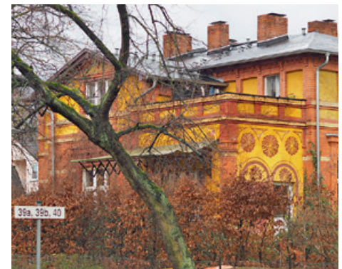
Die vielen Bäume am Straßenrand und schicke kleine Häuser mit wenigen Wohnungen machen die Bahnhofstraße zu einer geruhsamen Insel weit ab von großstädtischer Geschäftigkeit

Wie so oft in Berlin hat auch diese Nachbarschaft viel Geschichtsträchtiges erlebt. Rund um den Bahnhof Lichterfelde scheinen es vor allem die technischen Neuerungen gewesen zu sein, die unser Leben bis heute prägen. Im Jungfernstieg, der Querstraße, erfand der Physiker Manfred von Ardenne 1930 mit der elektrischen Bildübertragung den Fernseher. Schon 1881 lies Werner von Siemens vor dem Bahnhof die weltweit erste elektrische Straßenbahn starten. Auch die fuhr freilich den Jungfernstieg hinunter, in Sichtweite zur Bahnhofstraße. Denn die Lichterfelder Bahnhofstraße selbst liegt bis heute dicht neben dem Weltgeschehen. Sie wirkt in ihrer Beschaulichkeit deshalb ganz anders als unsere Lichtenrader Hauptstraße. Es gibt keine