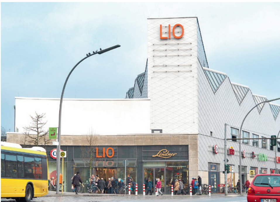
Das kleine Einkaufszentrum „LIO“ am Bahnhof Lichterfelde Ost, versorgt die Nachbarschaft mit dem Lebensnotwendigen. Die Schönen Dinge aber kaufen die Lichterfelder ...

und grade wegen der besonderen Artikel, die wir hier anbieten.“ In den Wohnvierteln um die Bahnhofstraße leben zwar viele ältere Leute. Aber die haben die Zeit und das Geld, um hier einzukaufen. Es gibt aber nicht nur Konsum, die nahe Petruskirche ist bekannter Aufführungsort für Jazz und zeitgenössische Musik. Außerdem ziehen genauso viele junge Familien nach und übernehmen den Lebensstil. Lichterfelde bleibt lebendig. Auch die Einkaufspassage LIO am Bahnhof stört die Harmonie nicht. Im Gegenteil, die beiden Supermärkte mit der Tiefgarage ziehen die Kunden hierher, die Inhaber der kleinen Geschäfte können sich gut mit der Nachbarschaft arrangieren.