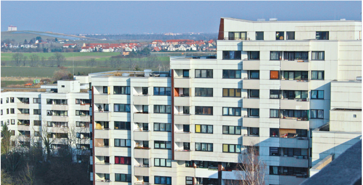
Blick auf den Nahariya-Kiez, der von 1974 – 1978 auf Ackerland erbaut wurde