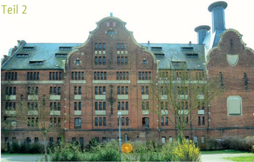
Ein Schlüsselobjekt im Förderprogramm – die Alte Mälzerei. Allerdings werden hier keine Wohnungen entstehen

Bereits in der Ausgabe 03/2017 haben wir einen Exkurs zur Städtebauförderung in Berlin gemacht. Wir haben davon berichtet, dass Berlin neben den Städtebauförderprogrammen für Berlin auch bei der Entwicklung der Stadt zu einem nachhaltigen und zukunftsfähigen Ort zum Wohnen, Arbeiten und Leben über nationale Projekte des Städtebaus mitarbeitet. Dabei ist die Innovation und Kreativität Berlin das Motto.