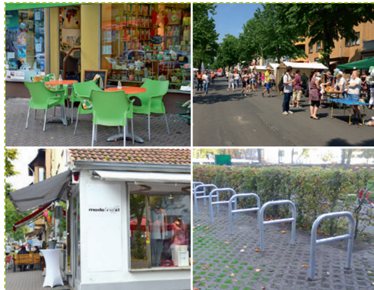
2017 wurden u.a. diese Projekte durch den Gebietsfonds realisiert.

Alle Termine finden Sie auch unter www.az-lichtenrade.de