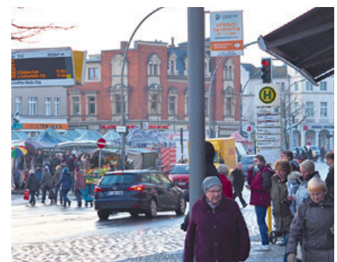
... lieber auf dem Ferdinandmarkt und in den Geschäften rund um den Kranoldplatz

Samstags und mittwochs schließlich will jeder zum Ferdinandmarkt auf dem Kranoldplatz. Dann ist auch die Bahnhofstraße fast komplett zugeparkt. Bei jedem Wetter herrscht dann ein ständiges Kommen und Gehen in der Siedlung. Der gut bestückte Wochenmarkt ist eine regelmäßige Attraktion, nicht nur für die Anwohner, sondern