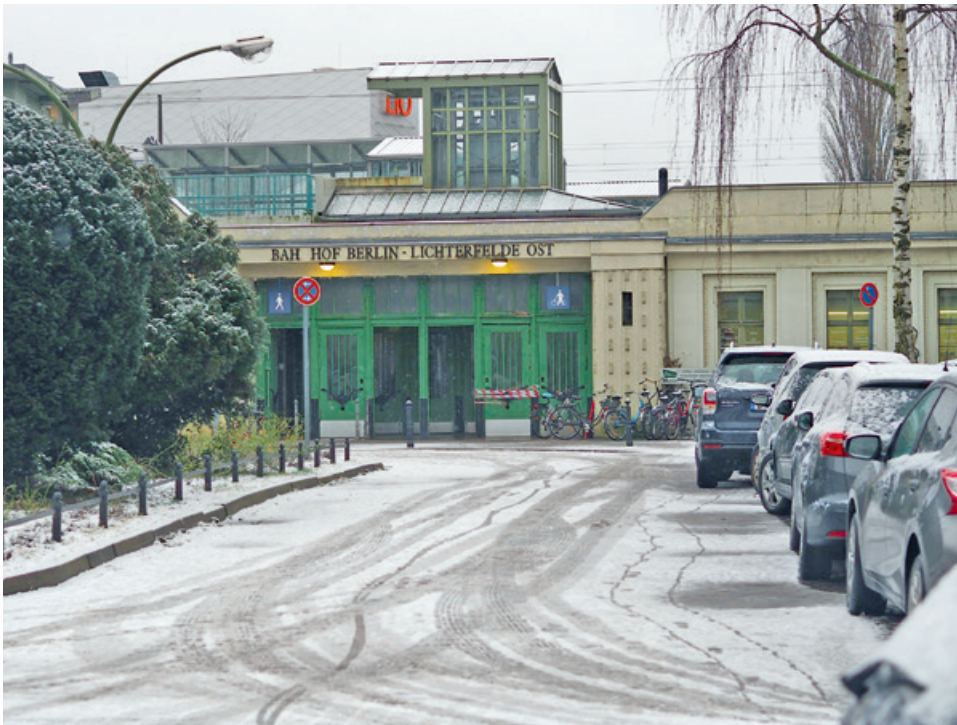
Die Bahnhofstraße mündet direkt in den kleinen Platz vor dem historischen Bahnhofsgebäude