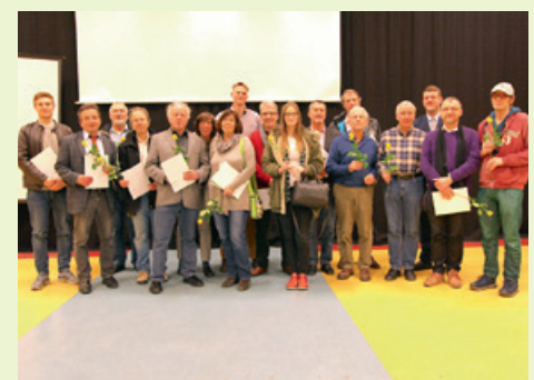
Das neu gewählte Gremium 2016 direkt nach der Wahl

Die ausführliche Wahlordnung kann eingesehen werden unter www.az-lichtenrade.de