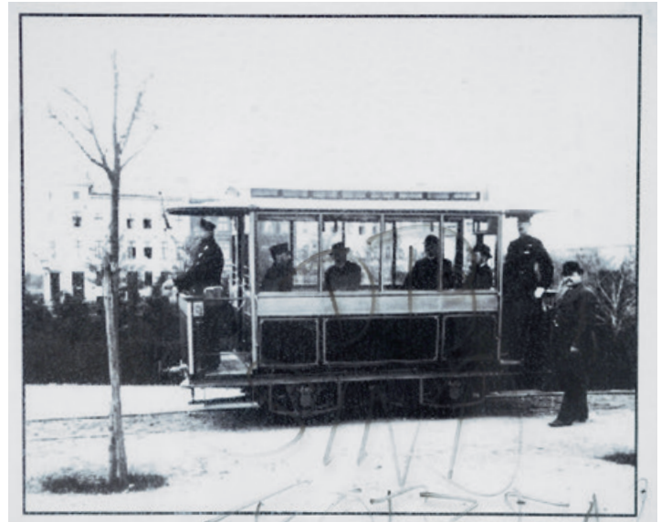
1881 liess Werner von Siemens vor dem Bahnhof die weltweit erste elektrische Straßenbahn starten. Sie fuhr allerdings den Jungfernstieg hinunter, in Sichtweite zur Bahnhofstraße

Geschäfte. Nur an ihrem Ende, auf dem kleinen Bahnhofsvorplatz, finden sich eine Hand voll Läden. Die gehören aber alle natürlich wieder in den Jungfernstieg. Doch der Anblick täuscht. Denn auch die Lichterfelder Bahnhofstraße befindet sich eigentlich mitten im Zentrum einer selbstbewussten, kleinen Gemeinde.